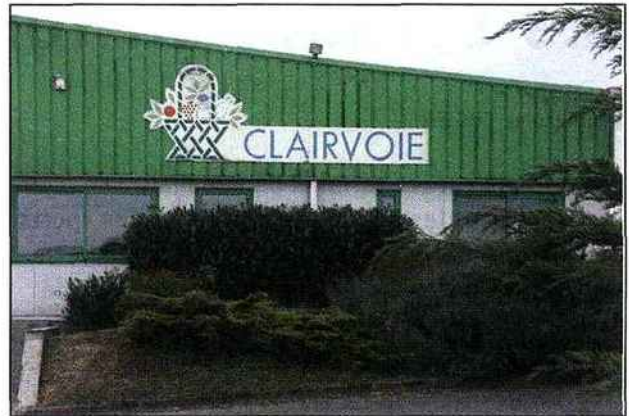
Le siège de Clairvoie est situé dans une zone industrielle discrète, rue Angèle-Richard à Beaurains près d'Arras.

Somme, Oise, Aisne et Seine-Maritime). Clairvoie a fait du service à domicile son cœur de métier en offrant un rayon alimentaire complet, sauf surgelé, avec notamment des produits frais de qualité à la coupe (jambon, fromage, etc.) ou au détail (fruits et légumes) aux